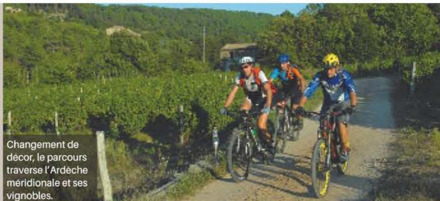
Changement de décor, le parcours traverse l'Ardèche méridionale et ses vignobles.