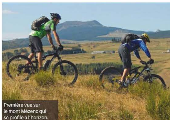
Première vue sur le mont Mézenc qui se profile à l'horizon.