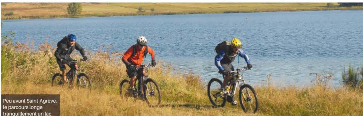
Peu avant Saint-Agrève, le parcours longe tranquillement un lac.

N ous ne pouvions passer plus longtemps sous silence cette Grande Traversée de l'Ardèche à VTT. Le processus est en cours de finalisation mais déjà un tronçon balisé de 150 km serpente sur le plateau des sources et des volcans de la montagne ardéchoise : une Trans'Ardèche qui relie déjà Saint-Agrève aux Vans. Un tracé nord-sud qui se peaufine au fil des ans. À terme le projet intégral reliera l'Ardèche verte à l'Ardèche méridionale. Cette belle idée mitonne depuis longtemps dans la marmite de certains Ardéchois. Elle s'est concrétisée récemment avec la mise en place d'un balisage et la sortie en 2015 d'un guide concocté par Edmond Gayral et Mathieu Morverand. Ces deux passionnés connaissent par cœur les sentiers de cette contrée parfois rude mais vectrice de fortes émotions. Edmond, cogérant d'Ardèche Vélo, engagé par sa profession et sa passion dans le développement de sports nature, a un attachement viscéral à son pays et ses habitants ; Mathieu, kayakiste chevronné et