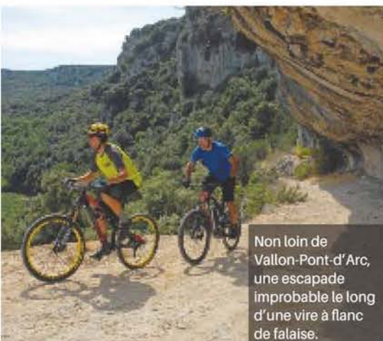
Non loin de Vallon-Pont-d'Arc, une escapade improbable le long d'une vire à flanc de falaise.

Topoguide VTT sur la Grande Traversée de l'Ardèche du nord au sud, réalisé par Edmond Gayral et Mathieu Morverand : velo.glenatlivres.com.