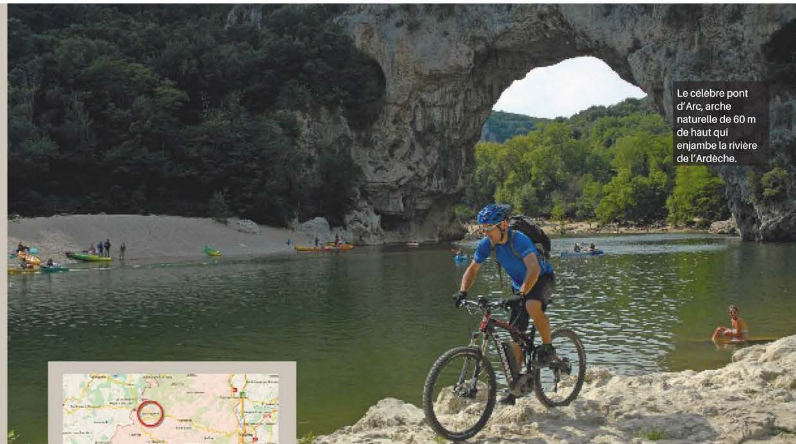
Le célèbre pont d'Arc, arche naturelle de 60 m de haut qui enjambe la rivière de l'Ardèche.

Espace VTT/FFC de "la montagne ardéchoise". 840 km de parcours balisés. Pays des grands espaces, situé au cœur du pays des volcans et des sources. OT "Entre Loire et Allier" : 04 66 46 12 58. OT Cévenne et Montagne Ardéchoise : 04 66 46 65 36. Espace VTT/FFC du Pays de Saint-Félicien. Situé au cœur de l'Ardèche verte. 150 km répartis sur sept circuits. OT du Pays de Saint-Félicien : 04 75 06 06 12. Site : www.tourisme-saintfelicien.fr Pour découvrir l'Ardèche en VTTAE : vous pouvez vous renseigner auprès des 10 points de location de la montagne ardéchoise. De Saint-Martial à Sainte-Eulalie en passant par le lac d'Issarlès, Montselgues et jusqu'aux Vans. À découvrir plus de 850 km de pistes balisées réparties sur 50 circuits. Découvrez ces points de vente en consultant le "flyer" dédié à cette prestation sur le site : www.la-montagne-ardechoise.com.