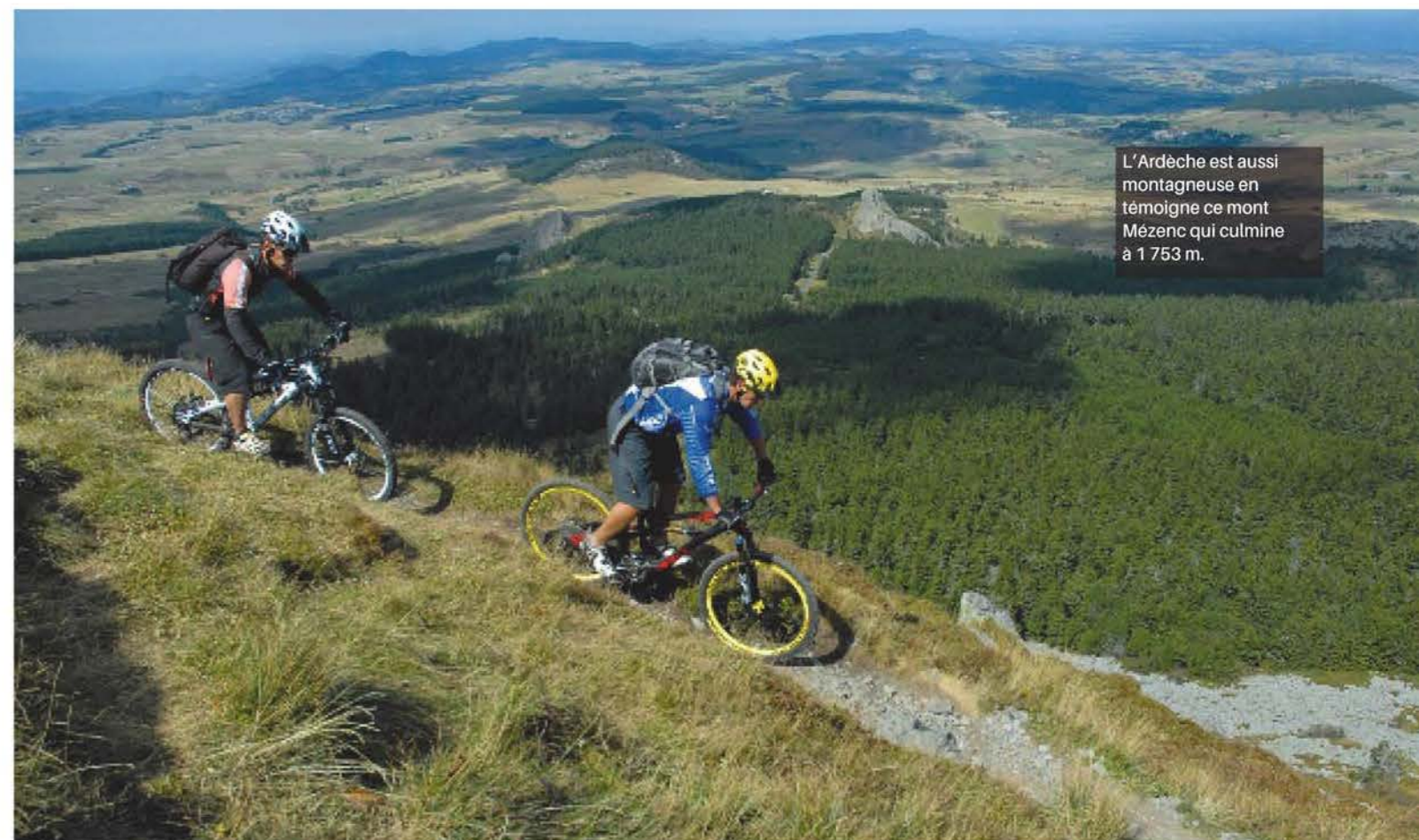
L'Ardèche est aussi montagneuse en témoigne ce mont Mézenc qui culmine à 1 753 m.

Ce reportage couvre la zone qui s'étend de la montagne ardéchoise à l'Ardèche méridionale, en gros de Saint-Agrève à Vallon-Pont-d'Arc. Un parcours varié, dont les photos montrent bien toute la diversité des paysages. Les sols, le climat et la végétation en Ardèche changent à mesure que l'on "descend" vers le sud. La multiplicité des socles qu'ils soient granitiques, gréseux, schisteux ou calcaires ont façonné le paysage, la végétation, le patrimoine architectural et bien sûr, par conséquent, la vie de ses habitants. En roulant sur les sentiers on s'émerveille en découvrant, au fur et à mesure des kilomètres, des panoramas contrastés. Le Haut-Vivarais, humide et vert, pays de moyennes montagnes s'apparente plus au Massif central et s'étend de la vallée de l'Eyrieux aux Sucs et au mont Mézenc, le cœur de la fameuse montagne ardéchoise situé à une quarantaine de kilomètres d'Aubenas. Plus au sud vous découvrirez un terroir de grès rouge, jalonné de jolis villages perdus au milieu du →