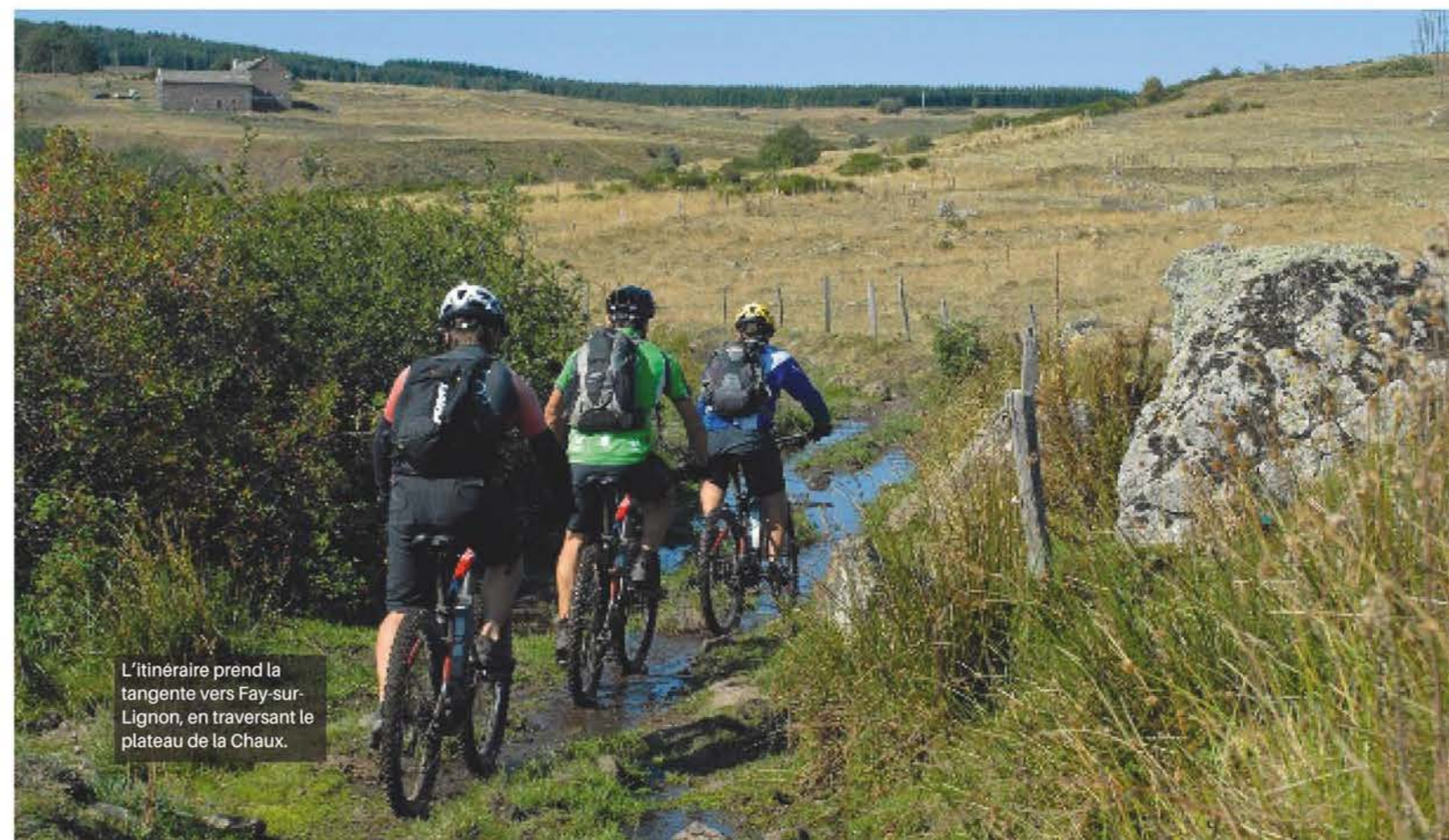
L'itinéraire prend la tangente vers Fay-sur-Lignon, en traversant le plateau de la Chaux.

“ LES SOLS, LE CLIMAT ET LA VÉGÉTATION EN ARDÈCHE CHANGENT À MESURE QUE L'ON "DESCEND" VERS LE SUD. ”